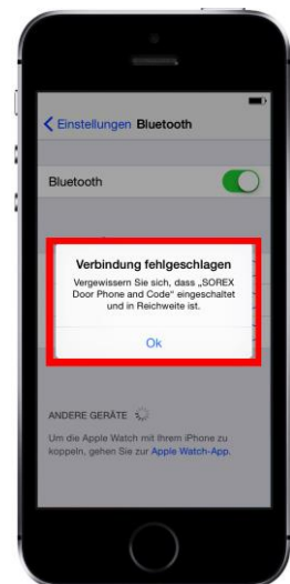
Diese Mitteilung kann ignoriert werden!

Hinweis: Besonders bei iOS-Geräten kann es passieren, dass eine Fehlermeldung trotz erfolgreicher Koppelung gezeigt wird, diese kann jedoch ignoriert werden. (Siehe Abbildung rechts)